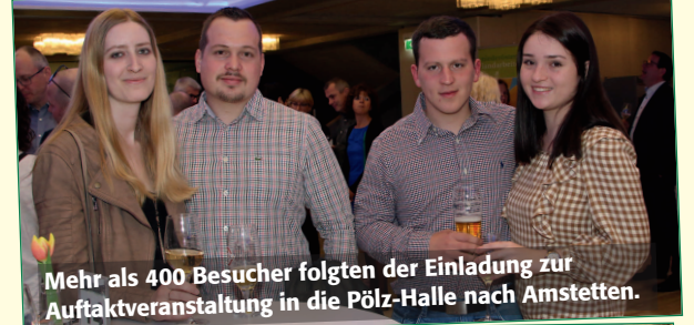
Mehr als 400 Besucher folgten der Einladung zur Auftaktveranstaltung in die Pözl-Halle nach Amstetten.