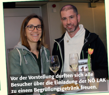
Vor der Vorstellung durften sich alle Besucher über die Einladung der NÖ LAK zu einem Begrüßungsgetränk freuen.