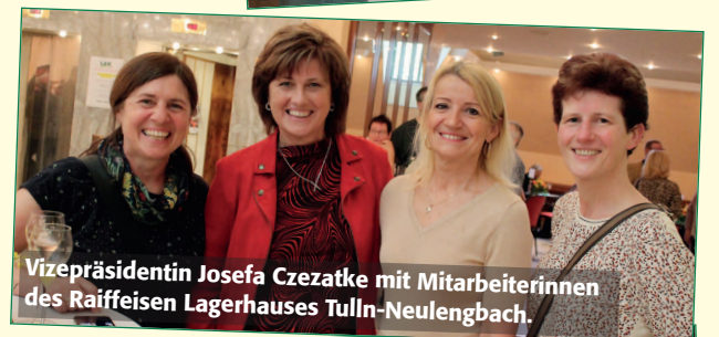
Vizepräsidentin Josefa Czeatke mit Mitarbeiterinnen des Raiffeisen Lagerhauses Tulln-Neulengbach.