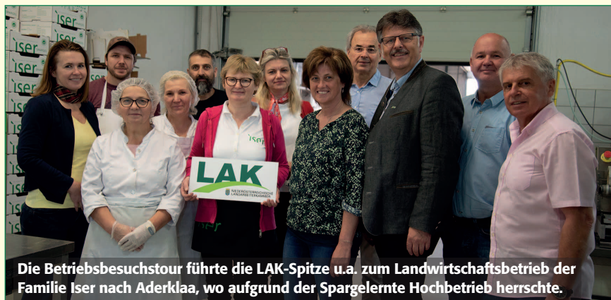
Die Betriebsbesuchstour führte die LAK-Spitze u.a. zum Landwirtschaftsbetrieb der Familie Iser nach Aderklaa, wo aufgrund der Spargelernte Hochbetrieb herrschte.