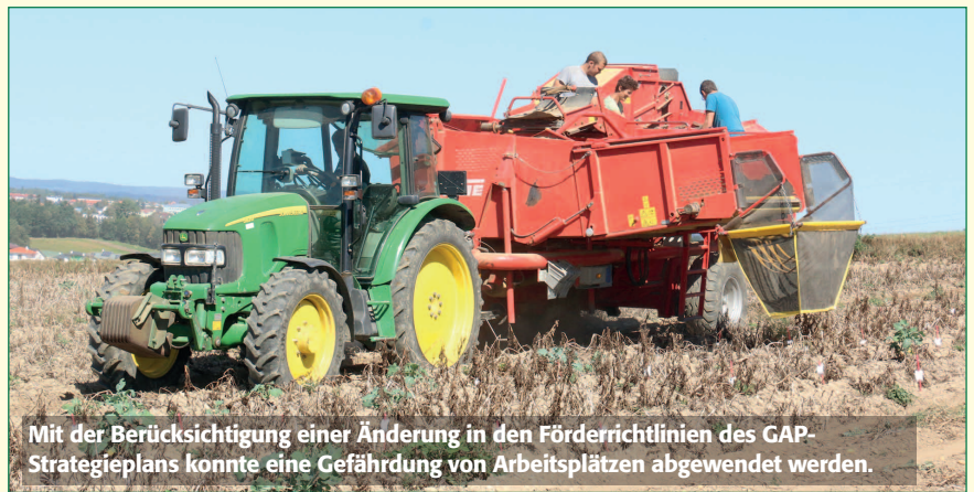
Mit der Berücksichtigung einer Änderung in den Förderrichtlinien des GAP-Strategieplans konnte eine Gefährdung von Arbeitsplätzen abgewendet werden.