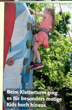
Beim Kletterturm ging es für besonders mutige Kids hoch hinaus.