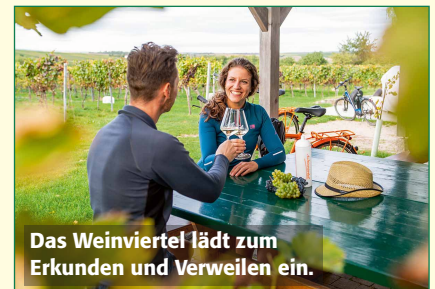
Das Weinviertel lädt zum Erkunden und Verweilen ein.

Den Kupon schicken Sie an: NÖ Landarbeiterkammer, Marco d'Avianogasse 1, 1015 Wien oder per E-Mail mit Namen, Adresse und gewünschtem Preis an gewinnspiel@lak-noe.at .