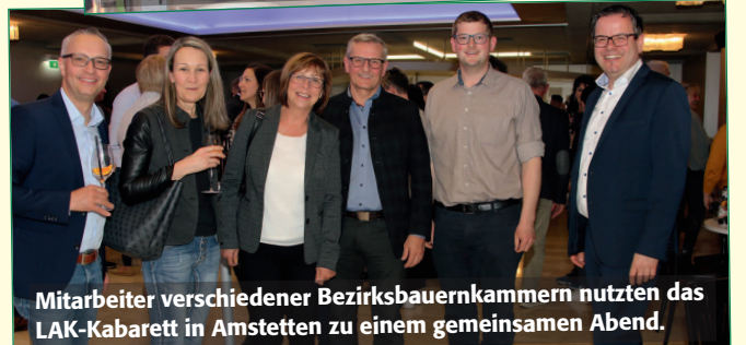
Mitarbeiter verschiedener Bezirksbauernkammern nutzten das LAK-Kabarett in Amstetten zu einem gemeinsamen Abend.