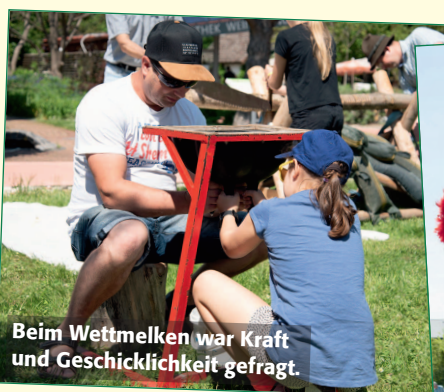
Beim Wettmelken war Kraft und Geschicklichkeit gefragt.

Für Kinder wurden quer über das Gelände der GARTEN TULLN zahlreiche Mitmachstationen aufgebaut, wo sie sich den ganzen Nachmittag über austoben konnten. Wer beim Zugsägen, Malen, Bogenschießen, Klettern, Kanufahren, Pflanzentopfen oder beim Tanzen mit der Jugendtanzgruppe „Bellarinas“ aus Eichgraben fleißig Punkte für seinen Stempelpass sammelte, durfte bei der abschließenden Tombolaverlosung teilnehmen und hatte die Chance, tolle Preise gewinnen. Für strahlende Kinderaugen und beste Stimmung sorgten