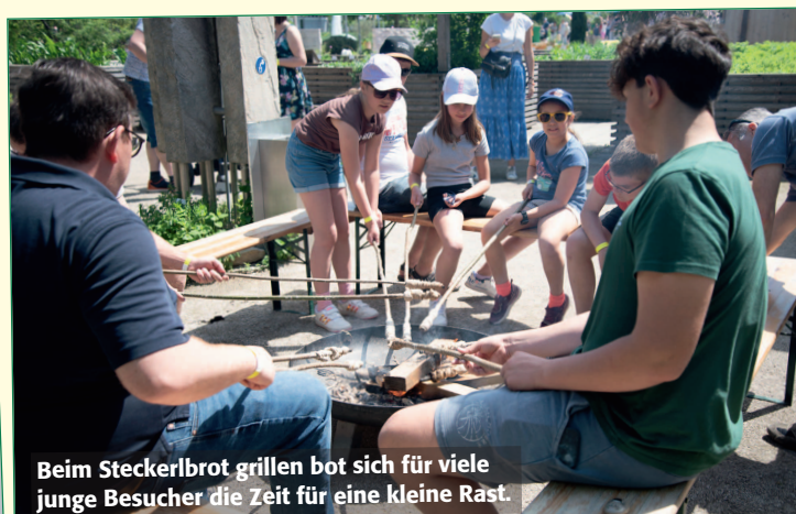
Beim Steckerlbrot grillen bot sich für viele junge Besucher die Zeit für eine kleine Rast.