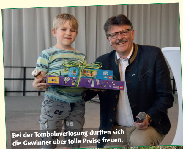
Bei der Tombolaverlosung durften sich die Gewinner über tolle Preise freuen.