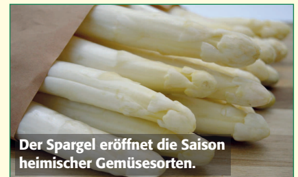
Der Spargel eröffnet die Saison heimischer Gemüsesorten.

Kulinarische Highlights, malerische Kellergassen und gesellige Weinfeste. Das Weinviertel ist ein Ort zum Erholen, Entdecken und Genießen. Während sich im Sommer die Gelegenheit zum Tafeln bietet, lässt sich die Region das ganze Jahr auf den vielfältigen Radrouten erkunden. Im Herbst laden Kellergassen- und Weinfeste zu einem Besuch ein. Die NÖ LAK verlost 1 Wertgutschein in der Höhe von EUR 150,-. Eine Übersicht, bei welchen Betrieben Sie die Gutscheine einlösen können, finden Sie online unter www.weinviertel.at .