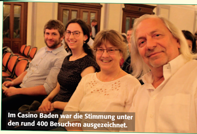
Im Casino Baden war die Stimmung unter den rund 400 Besuchern ausgezeichnet.