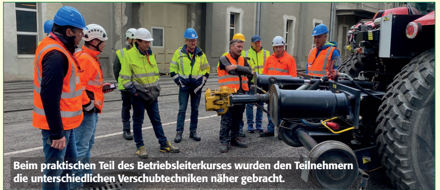
Beim praktischen Teil des Betriebsleiterkurses wurden den Teilnehmern die unterschiedlichen Vershubtechniken näher gebracht.

Während sich das laufende Kursjahr dem Ende zuneigt, starten im LAK-Bildungsreferat bereits die Planungen für das kommende Kursprogramm 22/23. Wenn Sie Ideen für neue Inhalte haben, schicken Sie diese per E-Mail an melanie.hoeller@lak-noe.at .