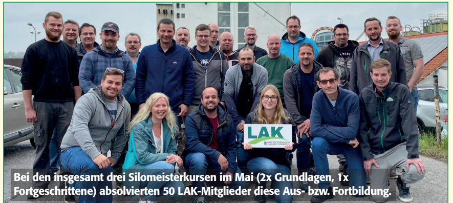
Bei den insgesamt drei Silomeisterkursen im Mai (2x Grundlagen, 1x Fortgeschrittene) absolvierten 50 LAK-Mitglieder diese Aus- bzw. Fortbildung.