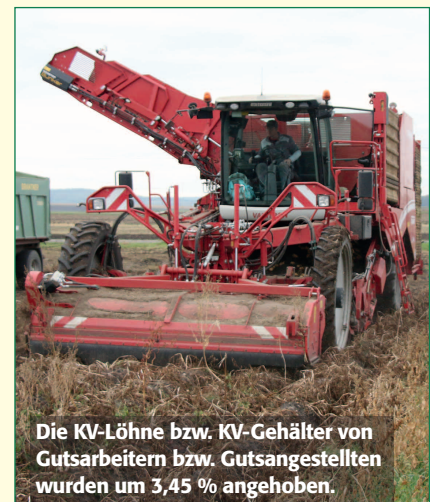
Die KV-Löhne bzw. KV-Gehälter von Gutsarbeitern bzw. Gutsangestellten wurden um 3,45 % angehoben.

Übersicht über KV-Abschlüsse 2022 Land & Forstwirtschaft