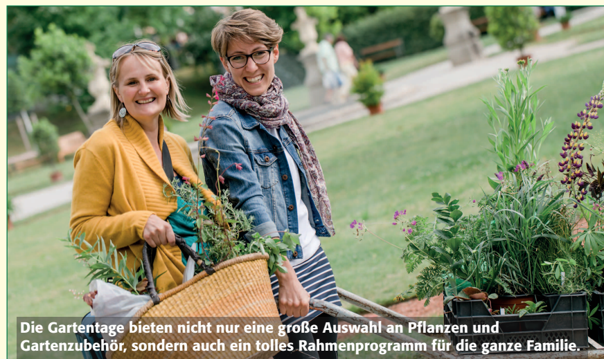
Die Gartentage bieten nicht nur eine große Auswahl an Pflanzen und Gartenzubehör, sondern auch ein tolles Rahmenprogramm für die ganze Familie.

Mitglieder der NÖ Landarbeiterkammer können beim Besuch der Gartentage gegen Vorlage einer LAK-Mitgliedsbestätigung eine Eintrittsermäßigung (EUR 7,- statt EUR 8,-) in Anspruch nehmen.