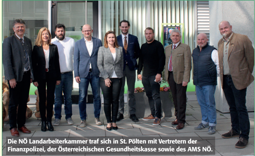
Die NÖ Landarbeiterkammer traf sich in St. Pölten mit Vertretern der Finanzpolizei, der Österreichischen Gesundheitskasse sowie des AMS NÖ.

Damit dieser Kontrolldruck aufrecht bleibt, wird es auch heuer während der Saison zu Schwerpunktaktionen durch