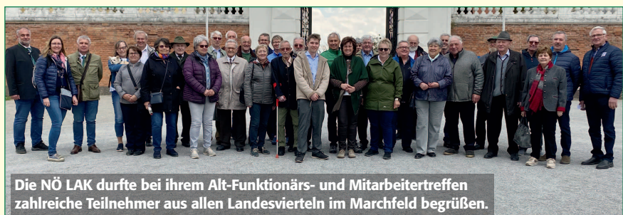
Die NÖ LAK durfte bei ihrem Alt-Funktionärs- und Mitarbeitertreffen zahlreiche Teilnehmer aus allen Landesvierteln im Marchfeld begrüßen.