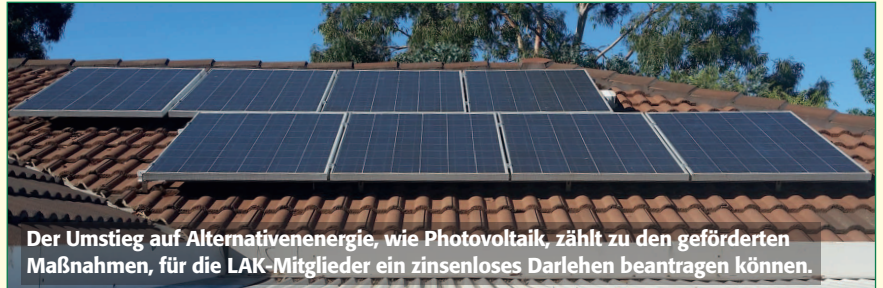
Der Umstieg auf Alternativenenergie, wie Photovoltaik, zählt zu den geförderten Maßnahmen, für die LAK-Mitglieder ein zinsloses Darlehen beantragen können.

Bei Fragen wenden Sie sich an das LAK-Baureferat unter 01/512 16 01 24 oder an ihre zuständige LAK-Geschäftsstelle (siehe Seite 16).