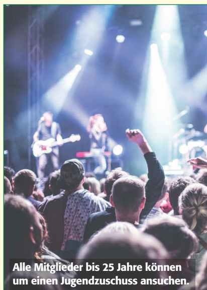
Alle Mitglieder bis 25 Jahre können um einen Jugendzuschuss ansuchen.