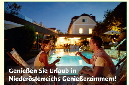
Genießen Sie Urlaub in Niederösterreichs Genießerzimmern!

Den Kupon schicken Sie an: NÖ Landarbeiterkammer, Marco d'Avianogasse 1, 1015 Wien oder per E-Mail mit Namen, Adresse und gewünschtem Preis an gewinnspiel@lak-noe.at .