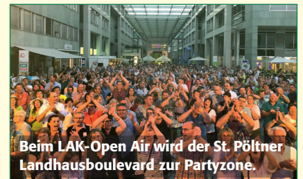
Beim LAK-Open Air wird der St. Pöltner Landhausboulevard zur Partyzone.

Eine Übersicht aller Genießerzimmer-Mitgliedsbetriebe und viele Angebote - unterteilt nach Regionen - finden Sie online unter www.geniesserzimmer.at .