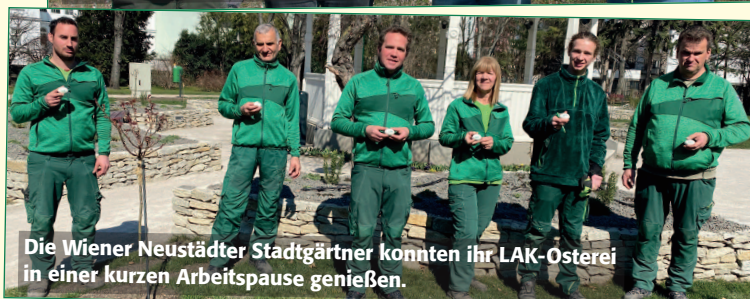
Die Wiener Neustädter Stadtgärtner konnten ihr LAK-Osterei in einer kurzen Arbeitspause genießen.