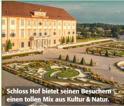
Schloss Hof bietet seinen Besuchern einen tollen Mix aus Kultur & Natur.

Mitte Juni steht beim Gesundheitstag, der diesmal im Waldviertel stattfindet, das Wohlbefinden der Senioren im Fokus.