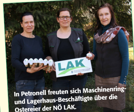
In Petronell freuten sich Maschinenring- und Lagerhaus-Beschäftigte über die Ostereier der NÖ LAK.

Weitere Fotos von der LAK-Osteraktion finden Sie auf der LAK-Website online unter www.landarbeiterkammer.at/noe in der Rubrik Aktuelles .