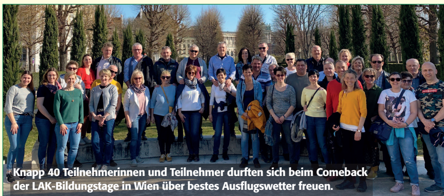
Knapp 40 Teilnehmerinnen und Teilnehmer durften sich beim Comeback der LAK-Bildungstage in Wien über bestes Ausflugswetter freuen.

Bei herrlichem Wetter wurde nach einem Spaziergang auf den Spuren der Habsburger u.a. der Stephansdom, das Schokomuseum des Traditionsunternehmens Heindl sowie die Schlumberger Kellerwelten besichtigt. Für einen unterhaltsamen Abend sorgte ein Besuch des