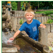
Familien-Tageseintrittskarte für DIE GARTEN TULLN

Die NÖ Landesweingüter haben anlässlich 100 Jahre Niederösterreich eine Sonderedition aus den beiden Leitsorten Grüner Veltliner und Zweigelt gekellert. Die NÖ LAK verlost 2 Geschenkboxen mit je 1 Fl. Kremstal DAC Grüner Veltliner 2021 (LWG Krems), 1 Fl. Zweigelt 2019 Klassik (LWG Retz) sowie ein Glas Blütenhonig der Landw. Fachschule Warth und ein Stück Schokolade.